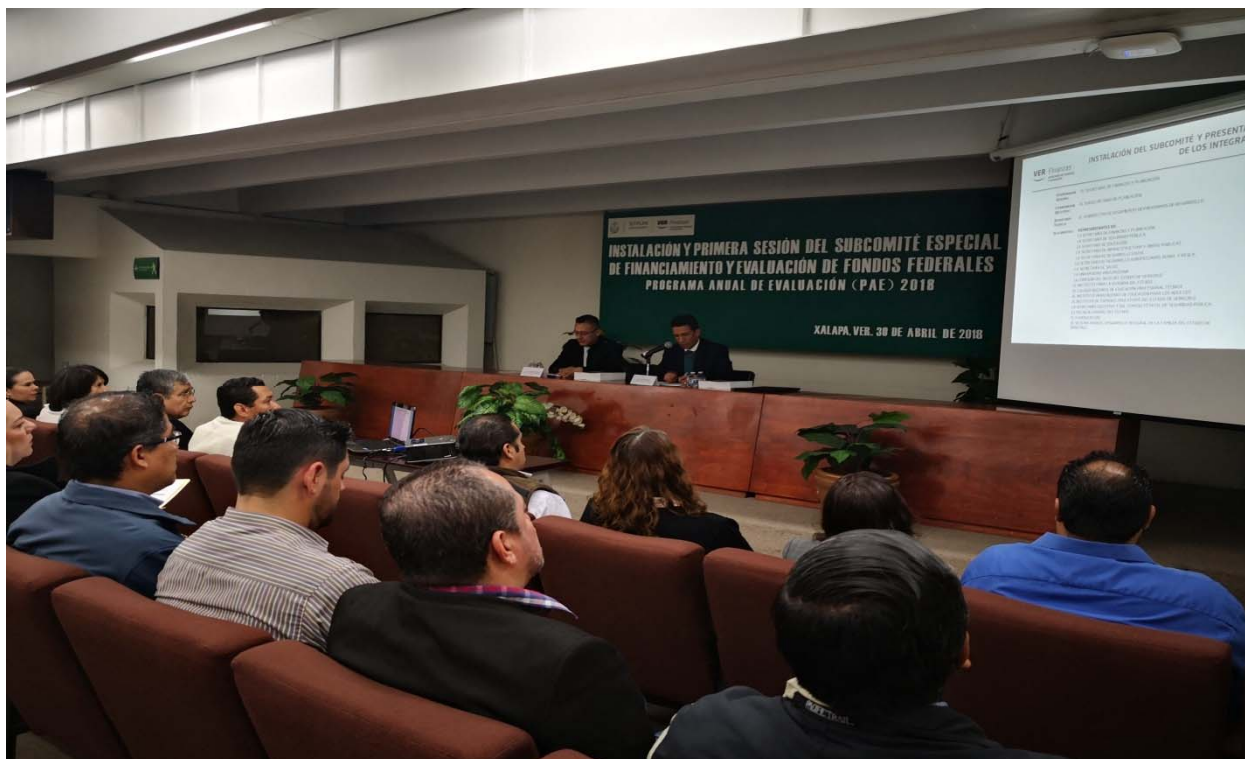
Subsecretario de Planeación y Coordinador Ejecutivo del Subcomité (derecha) y Subdirector de Seguimiento de Programas de Desarrollo y Secretario Técnico (izquierda).