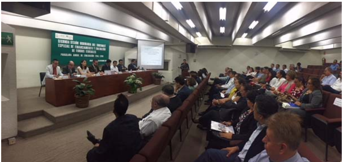
18 Enlaces Institucionales integrantes del SEFEFF que participaron en la Evaluación de Fondos Federales en el marco del PAE 2018 e invitados.

Con la presencia de 20 de los 20 integrantes (agregándose IPE) de la asamblea plenaria del SEFEFF (100%), hubo Cuórum legal para sesionar de conformidad a la convocatoria realizada mediante oficio SFP/SP/544/2018, los integrantes de la asamblea plenaria del SEFEFF (Enlaces Institucionales) se hicieron acompañar de las áreas de Administración, Planeación, Presupuestación, Evaluación y todas aquellas que tiene que ver con el manejo de los recursos de los Fondos Federales y se contó con la asistencia como invitados especiales a la Facultad de Contaduría y Administración- Maestría en Auditoría de la Universidad Veracruzana y Dirección de