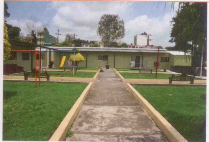
Supervisión del centro asistencial "Casa de Medio Camino" ubicado en la Ciudad de Xalapa, Veracruz, y el internado "Protección Social Femenina" ubicado en Banderilla, Veracruz.