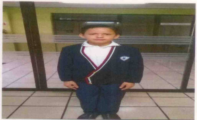
Menores alojados en el centro asistencial "La Esperanza" ubicado en la Ciudad de Orizaba, Veracruz, durante la visita de supervisión realizada el día 09 de junio de 2015.