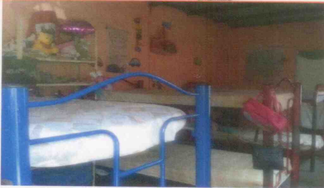
Supervisión del centro asistencial "Casa Hogar Por su Gracia Niños de Fé" y sus menores albergados, realizada el 05 de junio de 2015, en la Ciudad de Boca del Río, Veracruz.