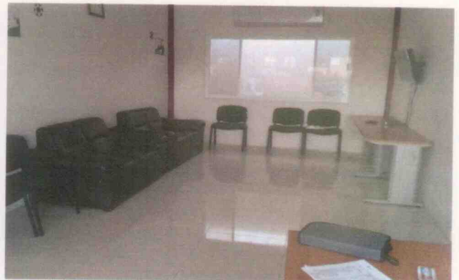
Supervisión del centro asistencial "Manuel Gutiérrez Zamora" y sus menores albergados, realizada el 05 de junio de 2015, en la Ciudad de Boca del Río, Veracruz.