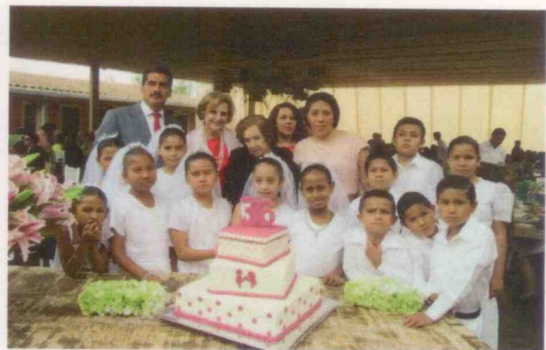
Actividades deportivas realizadas por los menores albergados del centro asistencial "Casa del Niño Xalapeño" dentro de las instalaciones del centro asistencial, y primeras comuniones.