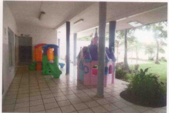
Supervisión del centro asistencial "Emelia L. Exsome Niñas" y sus menores albergados, realizada el 04 de junio de 2015, en la Ciudad de Veracruz, Veracruz.