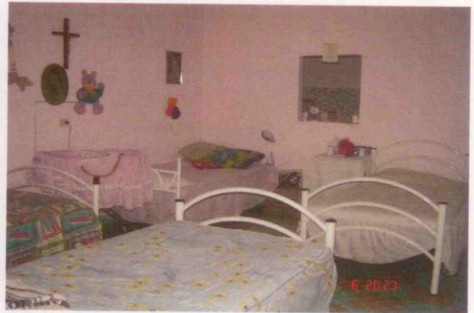
Supervisión del centro asistencial "Casa de Hogar Tepeyac" ubicado en la Ciudad de Xalapa, Veracruz.