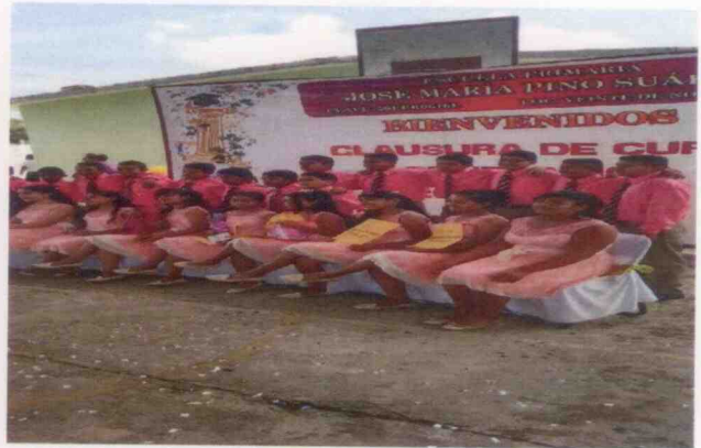
Graduaciones de nivel primaria, y secundaria de menores alojados en el centro asistencial "Peregrinos de la palabra de Dios" ubicado en la Ciudad de Córdoba, Veracruz.