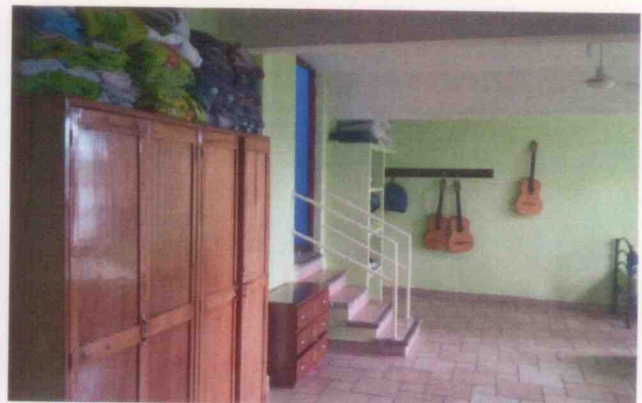
Supervisión del centro asistencial Aldea Meced Córdoba y sus menores albergados, realizada el 10 de junio de 2015, en la Ciudad de Córdoba, Veracruz.