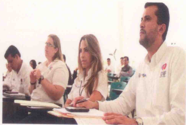
Capacitación y Asesoría de la Ley número 573 de los Derechos de Niñas, Niños y Adolescentes del Estado de Veracruz de Ignacio de la Llave, impartida por el Subprocurador de Asistencia Jurídica Familiar, Centros Asistenciales y sus similares del Estado de Veracruz, para Directores de Centros Asistenciales y Procuradores Municipales, en el auditorio del Sistema DIF Estatal de Veracruz.