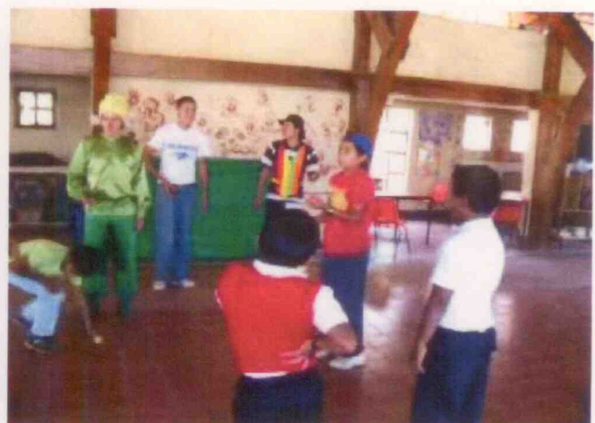
Menores y personal del centro asistencial "Aldea Meced Xalapa", ubicado en la Ciudad de Xalapa, Veracruz.

Handwritten notes and signatures on the right margin, including a large signature at the bottom.