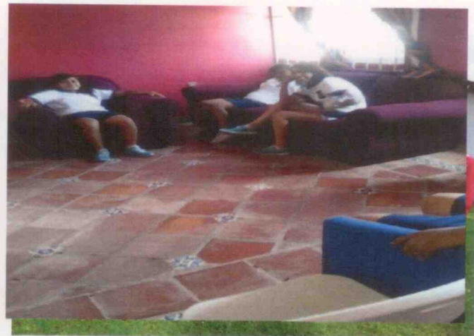
Menores y adolescentes albergados en el centro asistencial Conecalli ubicado en Xalapa, Veracruz; desarrollando actividades de recreación.