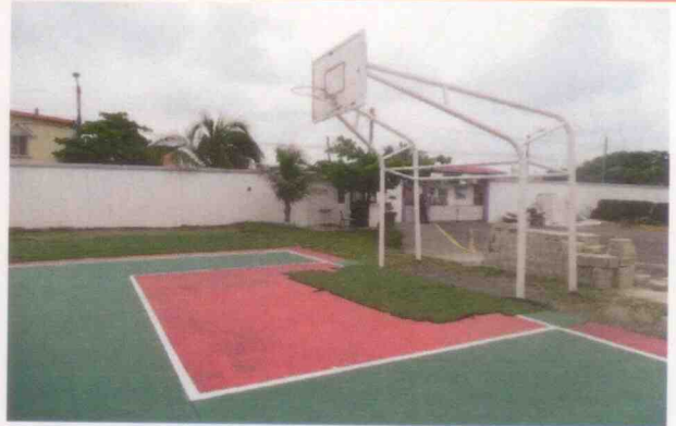
Supervisión del centro asistencial "Emelia L. Exsome Niños" y sus menores albergados, realizada el 04 de junio de 2015, en la Ciudad de Veracruz, Veracruz.