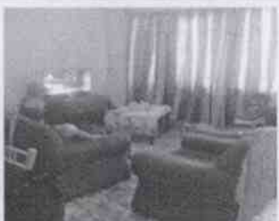
Supervisión de la Casa Hogar La Esperanza y las instalaciones en donde se encuentran menores albergados, en la Ciudad de Córdoba, Veracruz.