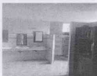
Supervisión del Mercado "Niño Santa María" y las instalaciones en donde se encuentran menores internados, en la Ciudad de Córdoba, Veracruz.