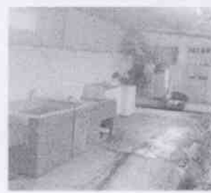
Supervisión de la Casa Hogar La Esperanza y las instalaciones en donde se encuentran menores albergados, en la Ciudad de Córdoba, Veracruz.