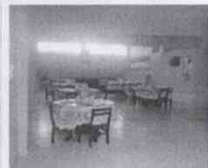
Supervisión del Mercado "Niño Santa María" y las instalaciones en donde se encuentran menores internados, en la Ciudad de Córdoba, Veracruz.