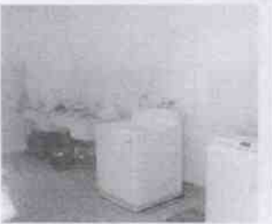
Supervisión de la Casa Hogar Aldea Misod Córdoba y las instalaciones en donde se encuentran menores albergados, en la Ciudad de Córdoba, Veracruz.