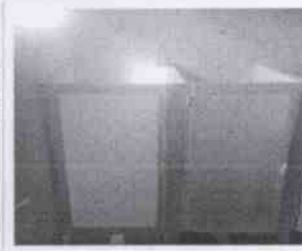
Supervisión de la Casa Hogar Aldea Misod Córdoba y las instalaciones en donde se encuentran menores albergados, en la Ciudad de Córdoba, Veracruz.