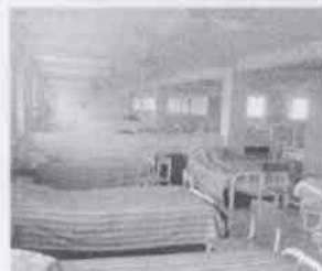
Supervisión del Mercado "Niño Santa María" y las instalaciones en donde se encuentran menores internados, en la Ciudad de Córdoba, Veracruz.