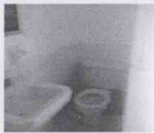
Supervisión de la Casa Hogar La Esperanza y las instalaciones en donde se encuentran menores albergados, en la Ciudad de Córdoba, Veracruz.