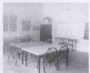
Supervisión de la Casa Hogar La Esperanza y las instalaciones en donde se encuentran menores albergados, en la Ciudad de Córdoba, Veracruz.