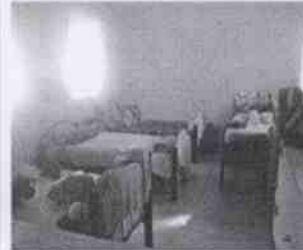
Supervisión de la Casa Hogar Córdoba, A.C. y las instalaciones en donde se encuentran menores albergados, en la Ciudad de Córdoba, Veracruz.