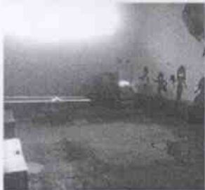
Supervisión de la Casa Hogar La Esperanza y las instalaciones en donde se encuentran menores albergados, en la Ciudad de Córdoba, Veracruz.