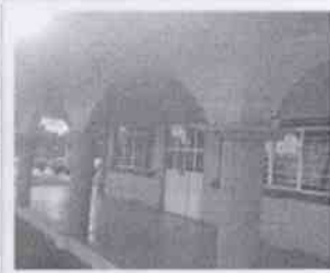
Supervisión de la Casa Hogar Hérosmos de la Palabra de Dios y las instalaciones en donde se encuentran menores albergados, en la Ciudad de Córdoba, Veracruz.