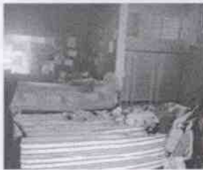
Supervisión de la Casa Hogar Peregrinos de la Palabra de Dios y las instalaciones en donde se encuentran menores albergados, en la Ciudad de Córdoba, Veracruz.