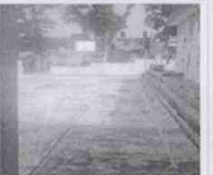
Supervisión de la Casa Hogar Aldea Misod Córdoba y las instalaciones en donde se encuentran menores albergados, en la Ciudad de Córdoba, Veracruz.