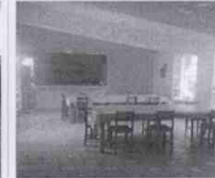
Supervisión de la Casa Hogar Aldea Misod Córdoba y las instalaciones en donde se encuentran menores albergados, en la Ciudad de Córdoba, Veracruz.