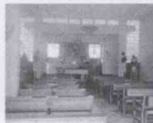
Supervisión del Mercado "Niño Santa María" y las instalaciones en donde se encuentran menores internados, en la Ciudad de Córdoba, Veracruz.