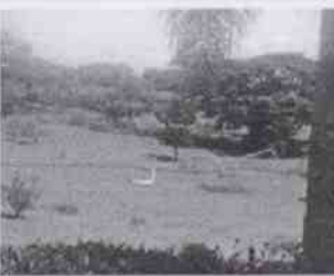
Supervisión de la Casa Hogar Hérosmos de la Palabra de Dios y las instalaciones en donde se encuentran menores albergados, en la Ciudad de Córdoba, Veracruz.