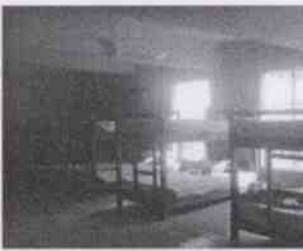
Supervisión de la Casa Hogar Aldea Misod Córdoba y las instalaciones en donde se encuentran menores albergados, en la Ciudad de Córdoba, Veracruz.