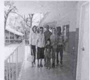
Reintegración de fecha 25 de septiembre de 2015, del menor Luzán, quien se encontraba en la Casa Hogar "La Compañía en Dios" ubicada en Martínez de la Torre, Veracruz.