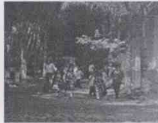
Supervisión a Casa Hogar Peregrinos de la Palabra de Dios y las instalaciones en donde se encuentran menores albergados, en la Ciudad de Córdoba, Veracruz.