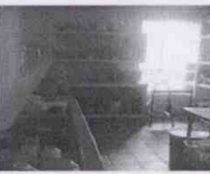
Supervisión de la Casa Hogar Aldea Misod Córdoba y las instalaciones en donde se encuentran menores albergados, en la Ciudad de Córdoba, Veracruz.