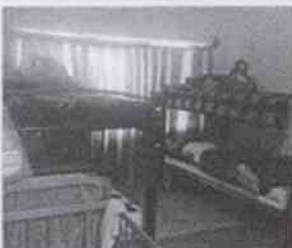
Supervisión de la Casa Hogar La Esperanza y las instalaciones en donde se encuentran menores albergados, en la Ciudad de Córdoba, Veracruz.