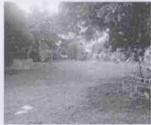
Supervisión de la Casa Hogar Córdoba, A.C. y las instalaciones en donde se encuentran menores albergados, en la Ciudad de Córdoba, Veracruz.