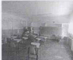
Supervisión de la Casa Hogar Córdoba, A.C. y las instalaciones en donde se encuentran menores albergados, en la Ciudad de Córdoba, Veracruz.