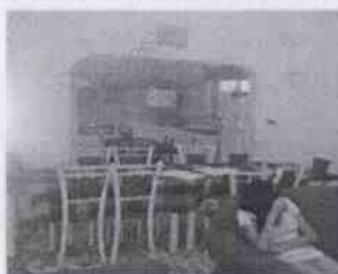
Supervisión de la Casa Hogar La Esperanza y las instalaciones en donde se encuentran menores albergados, en la Ciudad de Córdoba, Veracruz.