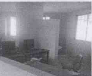
Supervisión de la Casa Hogar Aldea Misod Córdoba y las instalaciones en donde se encuentran menores albergados, en la Ciudad de Córdoba, Veracruz.