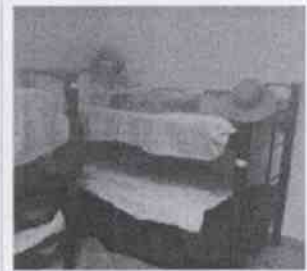
Supervisión de la Casa Hogar La Esperanza y las instalaciones en donde se encuentran menores albergados, en la Ciudad de Córdoba, Veracruz.