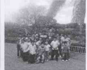
Supervisión de la Casa Hogar Peregrinos de la Palabra de Dios y las instalaciones en donde se encuentran menores albergados, en la Ciudad de Córdoba, Veracruz.